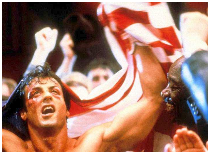
■ Nuit des 4 premiers Rocky, le samedi 23 janvier à partir de 21h30.

Après Eddy Merckx, quintuple vainqueur du Tour de France, et Jean-Claude Killy, triple champion olympique de ski, c'est au tour de Raymond Poulidor de lancer le round de chauffe du festival Cinéma, Sport et Littérature , lequel a également servi d'étape à Bernard Hinault, idem cinq victoires au Tour. D'une certaine façon, Raymond Poulidor a, lui aussi, tout gagné : Ceinture noire de la popularité, César de la franche camaraderie, Goncourt de la chouchouterie, il ne manque au palmarès de